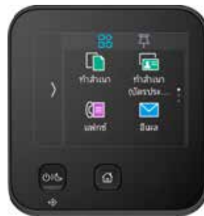
หน้าจอสีระบบสัมผัสขนาด 2.8 นิ้ว